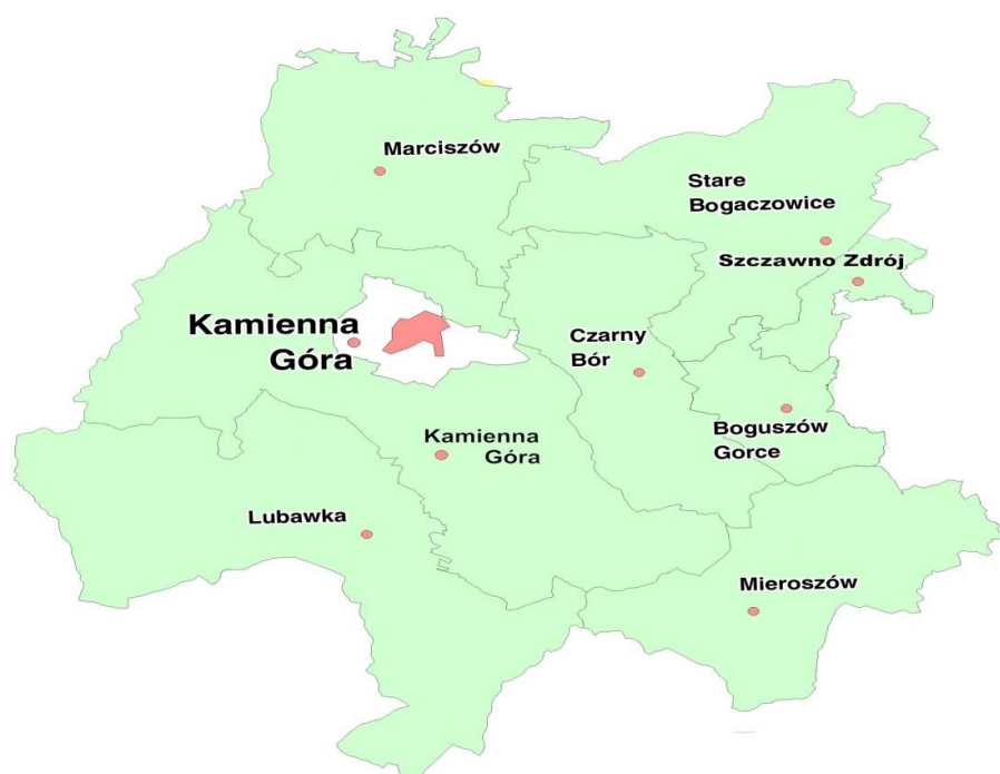
Rysunek 1. Mapa obszaru LSR